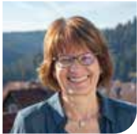
Ute Hinsberger Verwaltung

Die Angebote der Offenen Hilfen finden im Begegnungszentrum „Mittendrin“ in der Hirschkopfstraße 25, in Freudenstadt statt.